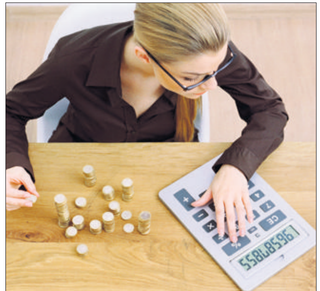
40% des Romandes ne maîtrisent pas les opérations simples.

Le centre d'orientation et de formation lausannois CORREF offre des cours de rattrapage